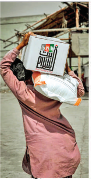
رمضان میں راشن تقسیم کیا گیا (مزید تصاویر برائے صفحہ 2 پر)

منظومین فلسطین کیلئے خد کا سلسلہ جاری SELA'EVİ YARDIM DERNEĞİ ترک اداروں کے اشتراک اور معاونت سے راشن، پکے پکائے کھانے اور دواؤں کی شکل میں امداد و تعاون کا سلسلہ جاری ہے بیت السلام ویلفیئر ٹرسٹ کے زیر اہتمام منظومین غزہ کے لیے روٹی پلانٹ لگایا گیا جہاں سے مسلسل روٹی کی سپلائی ہو رہی ہے بیت السلام اپنے ہم خیال ترک رفائی اداروں کے اشتراک سے عید قربان پر وقف قربانی کا گوشت پہنچانے کا بھی اہتمام کرے گا