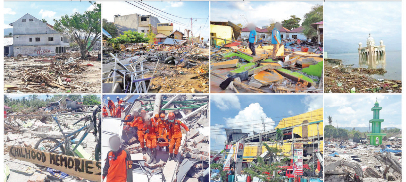
انڈونیشیا کے ساحلی علاقے پالو میں 5.7 کی شدت سے آنے والے زلزلے سے ہونے والی تباہی کا منظر قیامت خیز زلزلے اور ہونے والے ہزاروں افراد جاں بحق جب کہ لاکھوں بے گھر ہو گئے ہیں۔ امدادی کارروائیاں جاری ہیں۔

بیکری منزل کو بتایا گیا کہ ایسی کیسٹیشن کے لیے قابل قبول نہیں ہے۔ متقاعد بیت المقدس (ماہر ٹرنگ) کے ذریعے فلسطینی قیادت نے اقوام متحدہ کے خصوصی ایسی کیسٹیشن کے لیے قابل قبول نہیں ہے۔