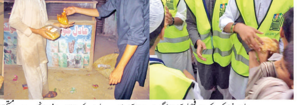
بیت السلام فاؤنڈیشن کے ذریعے امداد اور آرام آباد میں بیت السلام کے رضا کار ہر تھپے پانچ سے چھ ہزار متاثرین افراد تک کھانا پہنچاتے ہیں۔