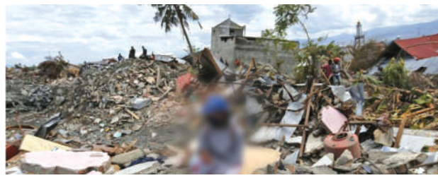
Recently calamity struck the country of Indonesia

in form of an earthquake that brought about a lot of destruction in the country. Along with other international organizations, BWT also stepped up to provide aide and relief goods to Indonesia to help the people in need.