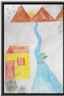
سمیرا نور دین چہارم، ایم ایس اسکول کراچی