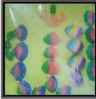
مریم سمیع دارالقہر اسکول کراچی