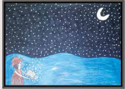
عائشہ گوہر، فیڈرل گورنمنٹ اسکول اسلام آباد