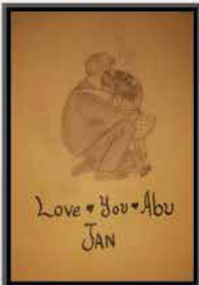
یسری فرحان البدر اسکول، کراچی