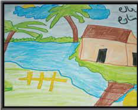
نسرین 5، الانڈا سکول کراچی